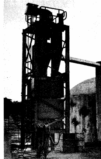
Recuperador de alcatrão em fornos de alvenaria

Assim, é uma empresa que reúne o homem, a técnica e a terra para produzir energia de fonte brasileira, renovável e com tecnologia inteiramente nossa contribuindo de maneira significativa para o esforço nacional de desenvolvimento de alternativas energéticas.