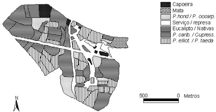
Figura 2 Plano de Informação "Uso da Terra". "Landuse" information layer.