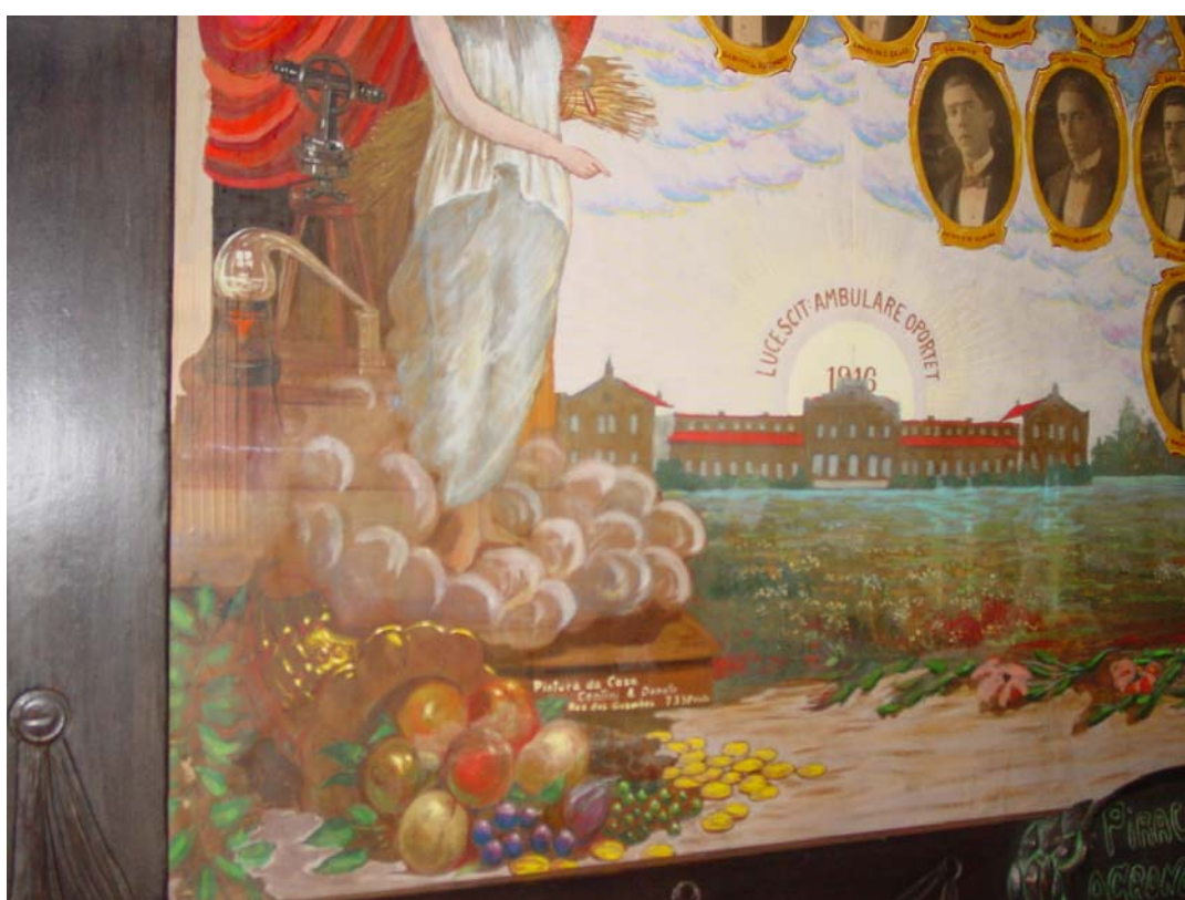
Figura 7 - Mural dos formandos da ESALQ de 1916 (Detalhe)

A primeira pergunta fica sem resposta por que foge muito aos objetivos deste trabalho. Para respondê-la teríamos de fazer especulações filosóficas acerca da condição humana. Quanto à segunda indagação, podemos dizer duas coisas. Primeiro, que havia uma querela forte entre os republicanos e a igreja católica, pois os republicanos promoveram a separação entre igreja e estado. Segundo, porque grande parte dos intelectuais e políticos da Belle Époque eram positivistas e, portanto, ateus ou agnósticos.