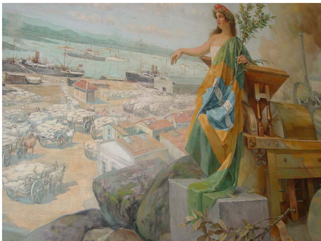
Figura 2 – O Porto de Santos e a intensa atividade de carregamento do café, por carroças e, principalmente, por ferrovia

Através da Figura 2, que é um detalhamento do quadro anterior, pode-se ver melhor a ferrovia conduzindo o café até a beira do cais, os galpões de armazenagem, os estivadores; Ceres, a deusa da agricultura na mitologia grega com a bandeira do Brasil e um ramo com café nas mãos; mais atrás o maquinário de beneficiamento com a chaminé soltando fumaça, até bem pouco tempo, um símbolo de progresso.