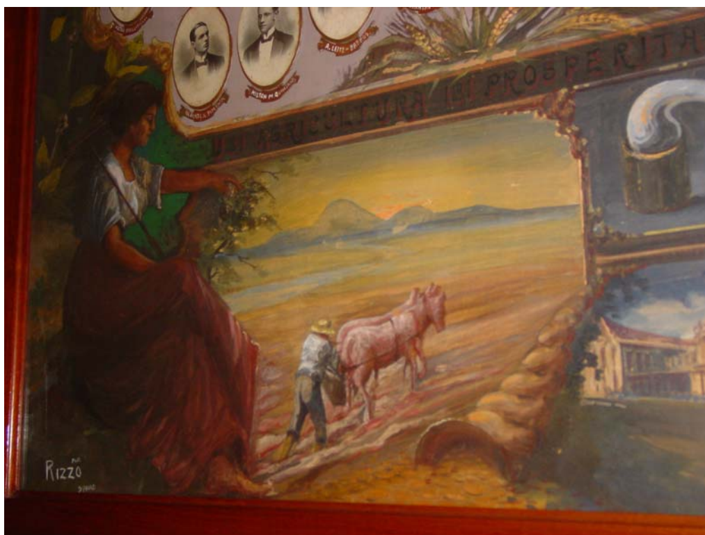
Figura 5 - Mural dos formandos de 1915

Na Figura 6 vemos o arado de disco, que desde o começo do século vinha sendo recomendado pela Revista Agrícola.