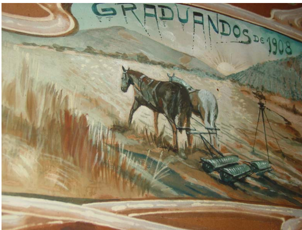
Figura 6 - Mural dos formandos de 1908

Nas duas figuras subseqüentes podemos observar a ESALQ vitoriosa, emitindo as luzes do saber e mostrando caminhos que estão iluminados. Ceres, os materiais de laboratório - simbolizando a ciência -, estão presentes, mas há um elemento novo, as moedas no solo junto aos frutos, o que dá um duplo sentido aos símbolos, tanto o solo pode ser riqueza, quanto os frutos, resultados do trabalho do homem. A presença da deusa grega Demeter, depois romanizada para Ceres, é pouco justificável, num mundo cristão, cujos símbolos centrais são o pão e o vinho, produtos derivados da agricultura, mas que também utiliza o óleo, a oliveira, o pombo, o peixe e o cordeiro. Então pode-se lançar duas perguntas: o que fazia com que homens imbuídos da ciência tivessem de recorrer a símbolos ligados à mitologia greco-romana? Por que não usar símbolos cristãos?