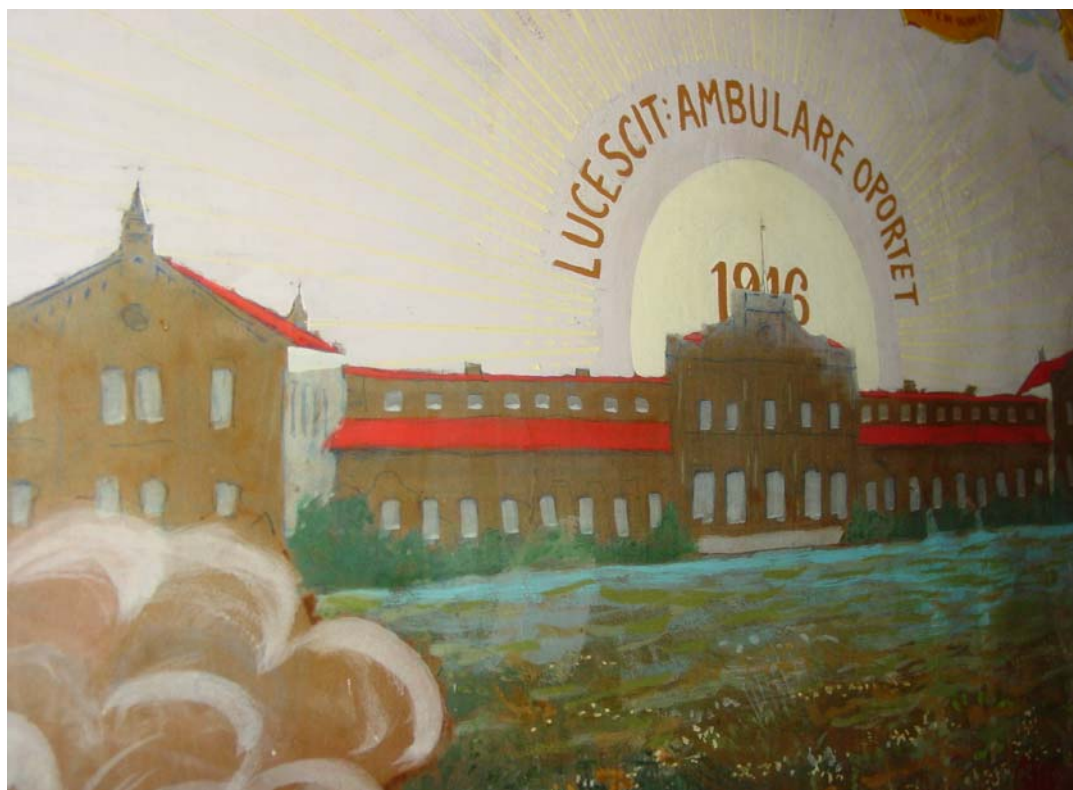
Figura 8 - Mural dos formandos da ESALQ de 1916 (Detalhe)

A confecção destes murais e sua preservação são indícios da importância que a ESALQ sempre atribuiu a sua missão de polo irradiador do ensino e da pesquisa na área da agronomia.