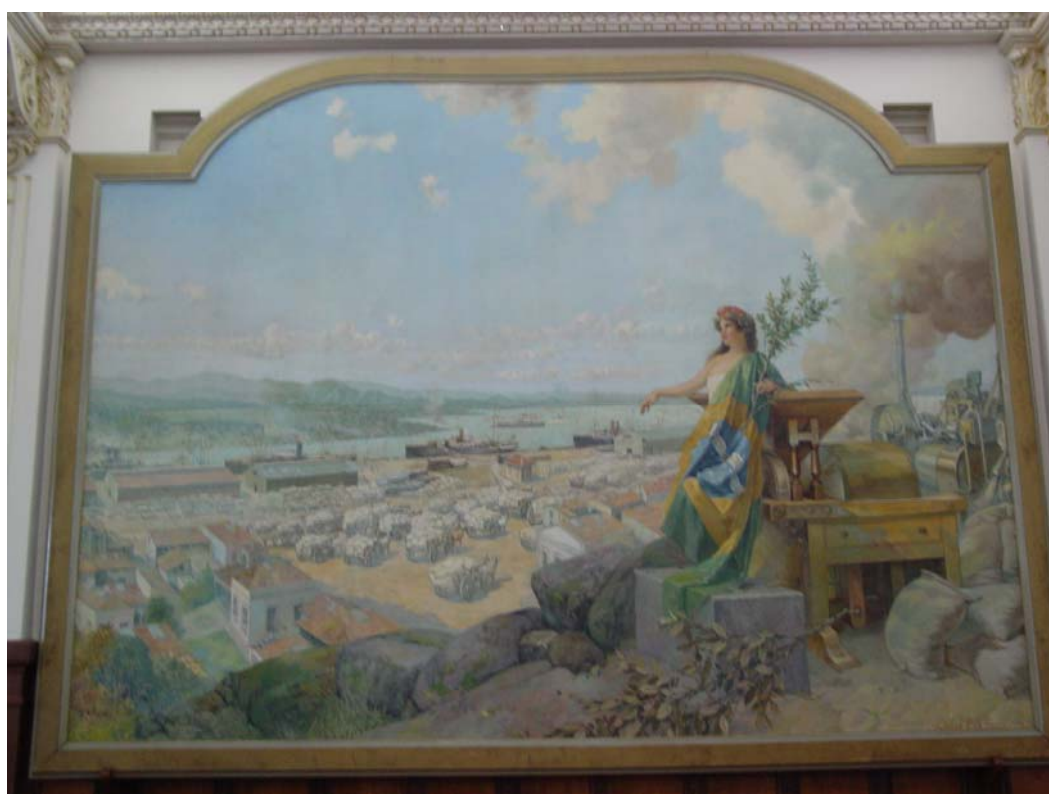
Figura 1 - A Exportação de Café no Porto de Santos

As reformas pretendidas na agricultura foram expressas de formas pictóricas nos quadros, vitrais e murais comemorativos dos formandos em seus respectivos anos. Imagens que estão expostas no prédio central da ESALQ. No Salão Nobre encontramos um quadro notável que retrata a maior riqueza do Estado naquela época, a exportação de café (Figura 1).