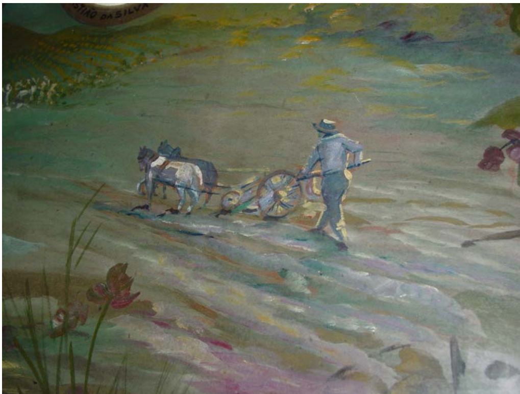
Figura 4 - Mural dos formandos de 1910 (Detalhe)

As figuras subseqüentes referem-se ao aspecto mais visível da modernização que era o uso do maquinário. A Figura 4 é um detalhe do mural dos formandos de 1900. O arado retratado era na época o que hoje chamamos de tecnologia de ponta.