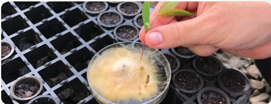
Avaliações microbiológicas e caracterização do potencial de utilização de bioinsumos em sistemas florestais.

As contribuições científicas e tecnológicas do PTSM resultaram em impactos concretos e duradouros sobre a produtividade e sustentabilidade das plantações florestais no Brasil. A geração de uma base de dados robusta, construída a partir de experimentos cooperativos de longo prazo conduzidos em diversas regiões edafoclimáticas, permitiu o desenvolvimento de soluções práticas e regionalizadas para os principais desafios do setor. Esses avanços se traduzem em protocolos e recomendações técnicas validadas em campo, que hoje subsidiam de forma direta as decisões estratégicas e operacionais das empresas cooperantes, promovendo ganhos consistentes em rendimento de madeira e na eficiência do uso de insumos. O PTSM consolida-se, assim, como um dos principais pilares de inovação em silvicultura tropical no hemisfério sul.