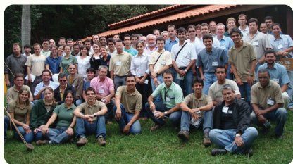
34ª Reunião técnico-científica do PTSM, realizada em corealização com a empresa Suzano e a Estação Experimental de Ciências Florestais da ESALQ/USP, em Itatinga (SP), nos dias 3 e 4 de abril de 2008, com a temática "Manejo de resíduos".

Ao promover a aproximação entre universidade, setor produtivo e centros de excelência científica, o PTSM contribui para a consolidação de uma nova geração de profissionais comprometidos com a inovação, a sustentabilidade e o avanço da silvicultura tropical, ampliando o capital humano estratégico do setor florestal brasileiro.