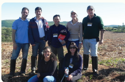
57ª Reunião do PTSM. Realizada na empresa CMPC, em Guaíba (RS), nos dias 23 e 24 de maio de 2018, com a temática “Planejamento, monitoramento e métodos de controle de plantas daninhas”. Programas do IPEF na foto: PROTEF, PPPIB e PCMAF.