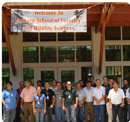
32ª Reunião técnico-científica do PTSM - Internacional. Realizada de 30 de junho a 14 de julho de 2007, com a temática "Inovações tecnológicas, pesquisa florestal e práticas silviculturais do sul e sudeste dos Estados Unidos".