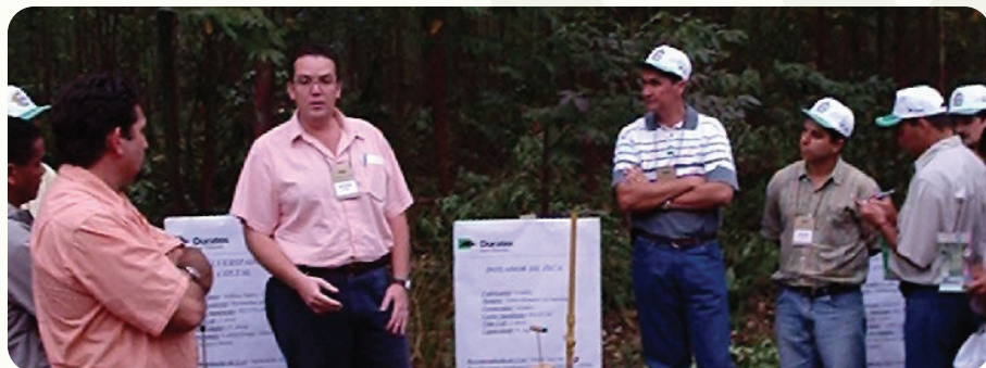
20ª Reunião do PTSM. Realizada nas empresas Ripasa e Duratex, em Botucatu e Itatinga (SP), de 6 a 8 de agosto de 2003, com a temática "Manejo por talhadia, controle de qualidade das operações silviculturais, uso de biossólidos e modelagem do crescimento de eucalipto".