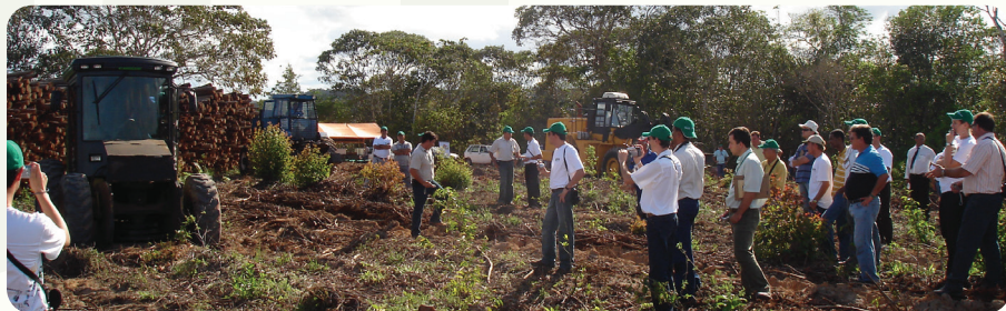
28ª Reunião técnico-científica do PTSM. Realizada na empresa Copener Bahia Pulp, em Alagoínhas (BA), nos dias 3 e 4 de maio de 2006, com a temática “Eficiência do uso da água e conservação do solo e da água em plantações florestais”.

Mais do que gerar conhecimento técnico, o PTSM transforma esse conhecimento em vantagem competitiva setorial, apoiando empresas na transição para uma silvicultura mais inteligente, resiliente e integrada às novas demandas ambientais e econômicas globais.