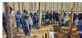
Visita técnica a empresa Amcel - Amapá.