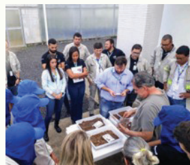
Visita técnica a empresa Copener.