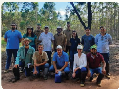
Visita aos experimentos do PTSM instalados na Estação Experimental de Ciências Florestais de Itatinga (ESALQ/USP), em Itatinga (SP).