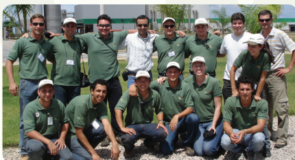
30ª Reunião técnico-científica do PTSM. Realizada na empresa Veracel, em Porto Seguro (BA), nos dias 30 de novembro e 1º de dezembro de 2006, com a temática "Unidade de manejo e sustentabilidade florestal".