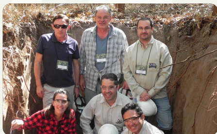
59ª Reunião do PTSM. Realizada na empresa Internacional Paper do Brasil (Sylvamo) nos dias 21 e 22 de maio de 2019, com a temática “Fertilizantes e fontes alternativas - alta performance e taxa de recuperação, bioestimulantes, recomendação e mitigação de estresses bióticos e abióticos.” Programas do IPEF na foto: PPPIB e PCMAF.

Essa abordagem colaborativa entre programas cooperativos fortalece o papel do IPEF como articulador de ciência aplicada para a silvicultura brasileira, promovendo avanços mais rápidos, eficientes e sistêmicos – e posicionando o PTSM como uma peça-chave na construção de uma silvicultura tropical cada vez mais integrada, inteligente e sustentável.