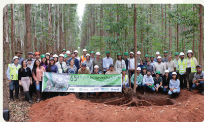
65ª Reunião do PTSM. Realizada em Botucatu e Itatinga nos dias 24 e 25 de abril de 2025, com a temática "Avanços científicos, tecnológicos e operacionais da talhadia".