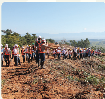
49ª Reunião técnico-científica do PTSM. Realizada em São José dos Campos (SP) nos dias 7 e 8 de maio de 2014, com a temática "Conservação e preparo do solo".