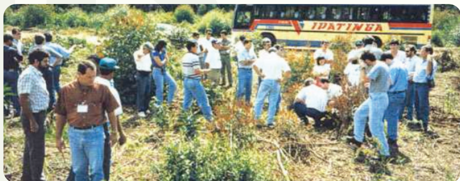
3ª Reunião técnico-científica do PTSM. Realizada na empresa Cenibra, em Ipatinga (MG), nos dias 11 e 12 de novembro de 1996, com a temática "Preparo do solo e seus impactos na produtividade do eucalipto".

Naquela época, o preparo intensivo do solo predominava: a queima de resíduos florestais, seguida de aração e gradagem, era uma prática comum. Entretanto, isso agravava os problemas de erosão, especialmente em solos arenosos e de textura média. As plantações ainda eram realizadas, em sua maioria, com mudas seminais. A partir de 1988, com a proibição da queima de resíduos culturais no estado de São Paulo (Lei Estadual nº 6.171/1988), houve um impulso à busca de alternativas sustentáveis.