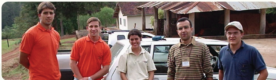
20ª Reunião do PTSM. Realizada nas empresas Ripasa e Duratex, de 6 a 8 de agosto de 2003, com a temática “Manejo por talhadia, controle de qualidade das operações silviculturais, uso de biossólidos e modelagem do crescimento de eucalipto”.