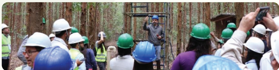
65ª Reunião técnico-científica do PTSM. Realizada em Botucatu e Itatinga (SP), nos dias 23 e 24 de abril de 2025, com a temática “Avanços científicos, tecnológicos e operacionais da talhadia”. Programas do IPEF na foto: Euclflux, SilviCarbo e PCoppice.