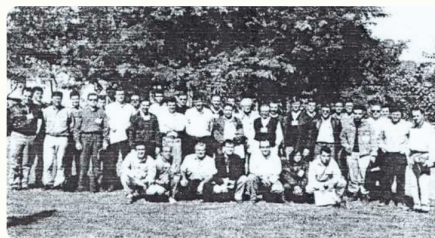
2ª Reunião Técnico-científica do PTSM. Realizada na empresa Champion de Papel e Celulose em Mogi Guaçu - SP, no dias 3 e 4 de junho de 1996, com a temática "Cultivo Mínimo".

A repercussão inicial do programa foi extremamente positiva, o que levou rapidamente à filiação de outras empresas. Em 1997, por iniciativa das empresas filiadas ao IPEF e membros do Conselho Deliberativo, o escopo do programa foi ampliado, passando a abranger todas as práticas de implantação, condução e manejo florestal. Assim, o programa foi rebatizado como Programa Temático de Silvicultura e Manejo (PTSM), consolidando sua identidade atual.