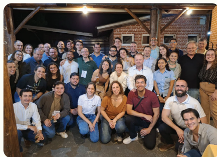
64ª Reunião técnico-científica do PTSM. Realizada na empresa Klabin, em Telêmaco Borba (PR), nos dias 6 e 7 de novembro de 2024, com a temática “Silvicultura resiliente: abordagens estratégicas para enfrentar as adversidades climáticas”.