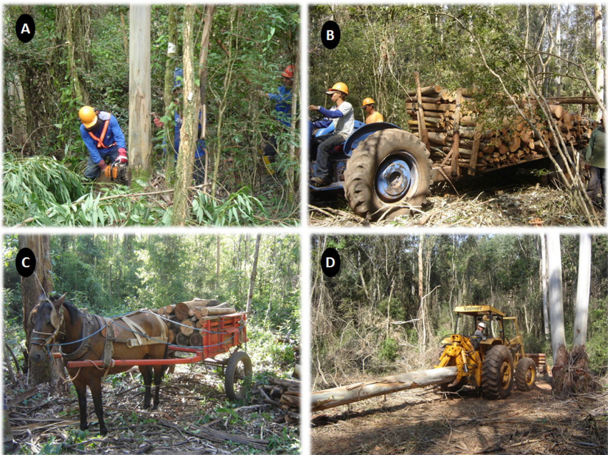
Figura 2. Modos de colheita florestal: (A) corte com motosserra; (B) extração mecanizada na etapa 1 (colheita de lenha); (C) extração com animal na etapa 1 (colheita de lenha); (D) extração mecanizada na etapa 2 (colheita de tora).

As avaliações dos impactos provenientes da colheita de madeira na estrutura da vegetação nativa do sub-bosque foram realizadas ao término de cada etapa de colheita, ou seja, após a extração do volume total de lenha e após a extração do volume total de tora. Os módulos de colheita florestal estão ilustrados na Figura 2.