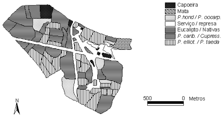
Figura 2 Plano de Informação "Uso da Terra". "Landuse" information layer.