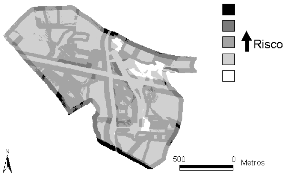
Figura 3 "Mapa-base" de risco de incêndios, reorganizado em classes de risco. Forest fire risk "Base map", reorganized in risk classes.