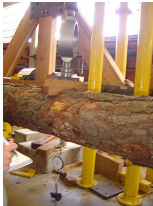
Figura 1. Ensaio de flexão estática em elemento estrutural roliço

Os elementos estruturais não foram rompidos para estimativa de sua capacidade de carga nos ensaios de flexão estática. Assim, três ciclos de carregamentos foram conduzidos em cada elemento roliço, e os deslocamentos nos seus pontos médios foram limitados ao valor do vão dividido por duzentos ( L/200 ), tendo como base o limite de utilização previsto na NBR 7190:1997 (ABNT, 1997), supondo-se então que o material esteja trabalhando no regime elástico.