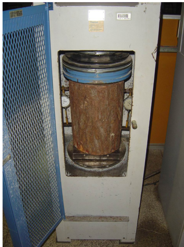
Figura 2. Ensaio de compressão paralela em elemento estrutural roliço

prova e as metodologias dos ensaios seguiram as recomendações do documento normativo brasileiro NBR 7190:1997 (ABNT, 1997).