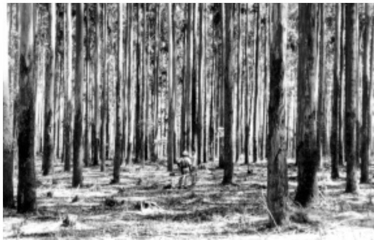
pinus grandis atherton.

cies nativas e exóticas, coleções de espécies, testes de procedências e progênies de Pinus , Eucalyptus , Araucaria e de espécies nativas, testes de espaçamento e adubação, testes de consorciação de espécies nativas e áreas para produção de sementes de Eucalyptus e Pinus ; e a EECF Itatinga com mais de 2.200ha distribuídos em programas de pesquisa em Melhoramento de Eucalyptus saligna , Eucalyptus Sub-Tropicais, Pinus elliottii , Pinus taeda , Espécies Nativas, Microbacia Experimental, Educação Ambiental e Residência Florestal.